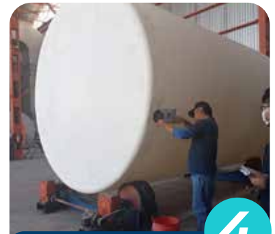
4 PRUEBA DE HERMETICIDAD

Realizamos pruebas neumáticas de hermeticidad sometiendo al tanque a diferentes presiones para garantizar la impermeabilidad y cero fugas.