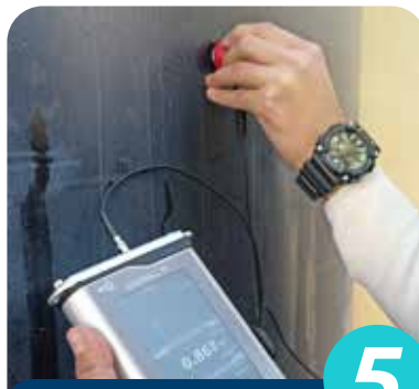
5 PRUEBAS SONOWALL

Prueba de espesor del tanque para avalar sea calibrado al 100% su reforzamiento en la parte inferior, media y superior.